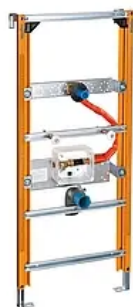
102543 WimTec FIX UR INSIDE - Laufen Caprino