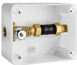
Erforderlich 101003 WimTec Rohbauset U1